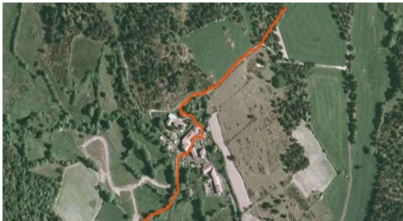
Détail de la traversée du Chemin de Mende dans Villevieillette